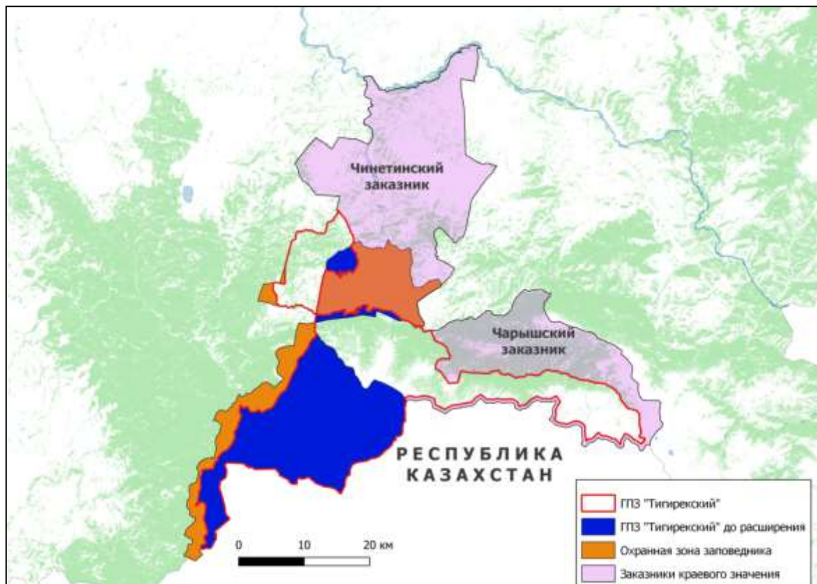
Рисунок 2. Границы заповедника «Тигирекский»